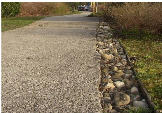
Petite tranchée drainante le long d'un espace piétonnier